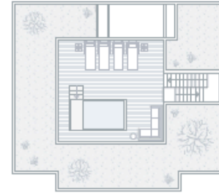
ROOFTOP / COBERTURA