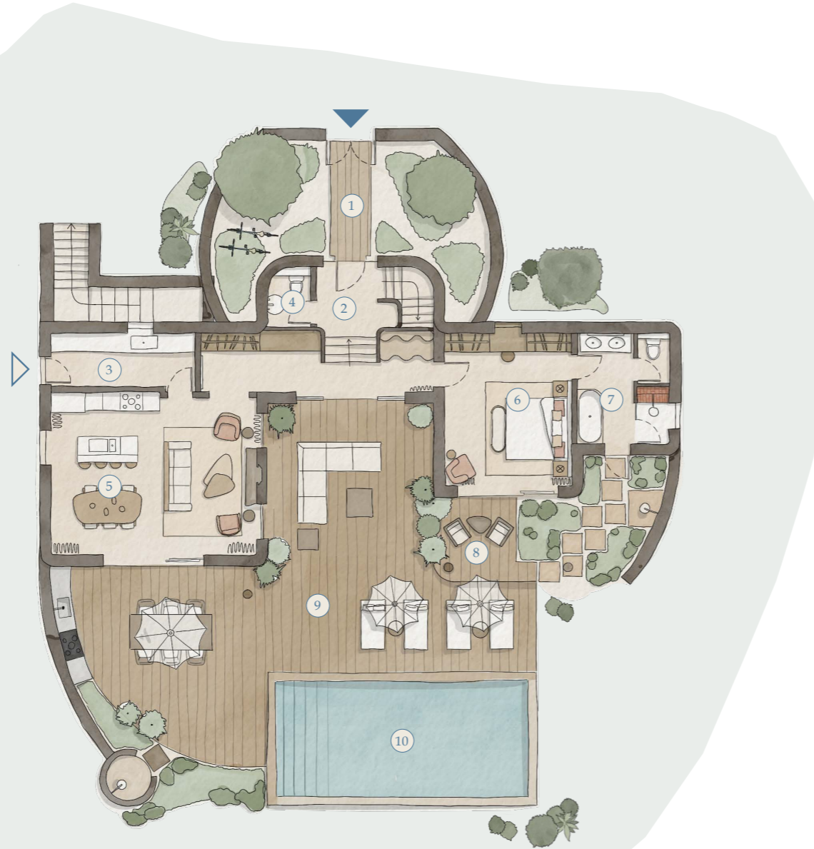
Ground Floor Piso 0