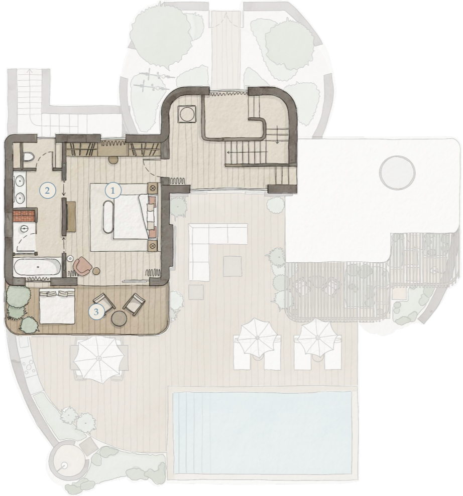
First Floor Piso 1