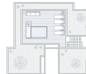
ROOFTOP / COBERTURA