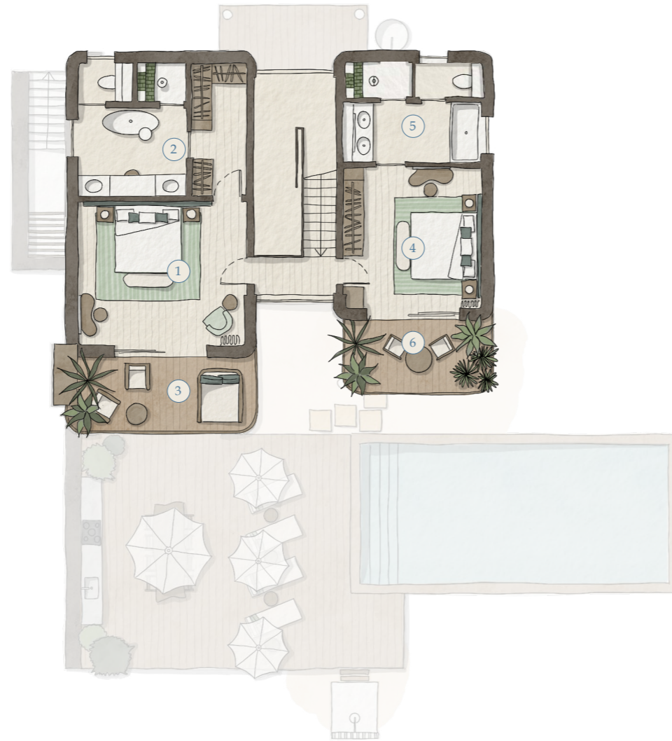
First Floor Piso 1