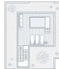
ROOFTOP / COBERTURA