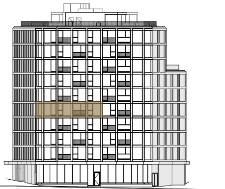
Avenida Duque de Ávila

10 Varanda 1 - 7,30 m 2 Balcony 11 Varanda 2 - 3,10 m 2 Balcony