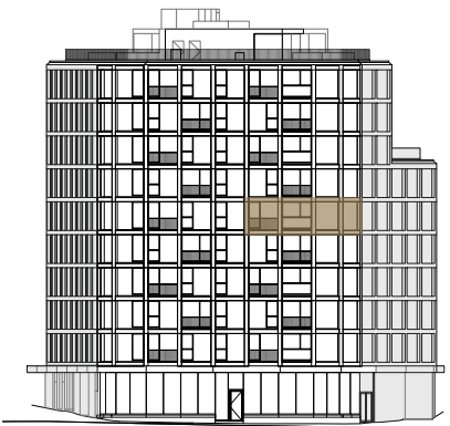
Avenida Duque de Ávila