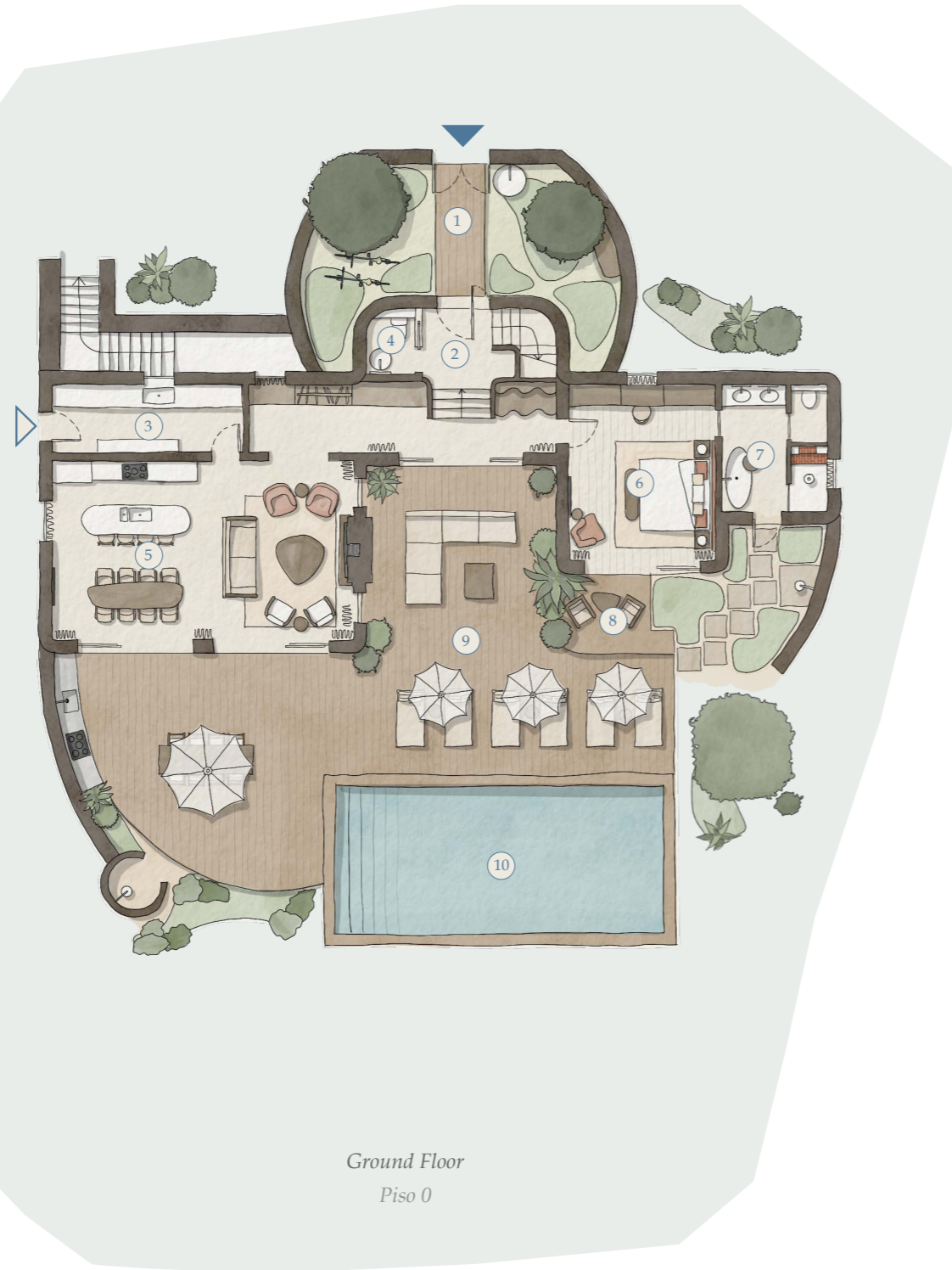
Ground Floor Piso 0